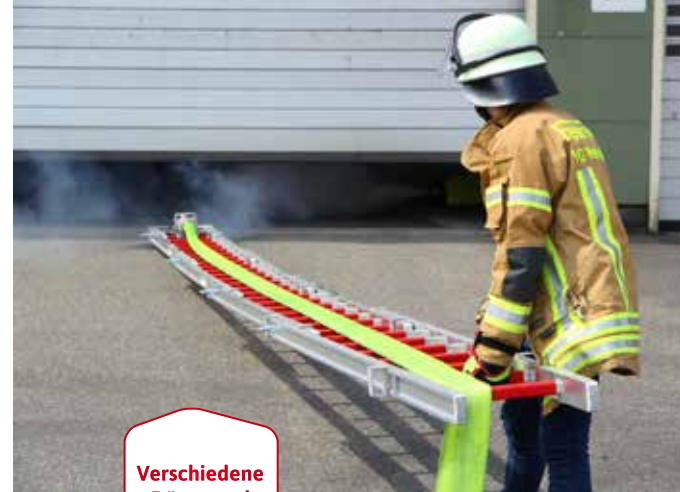
Verschiedene Düsen und Rollen